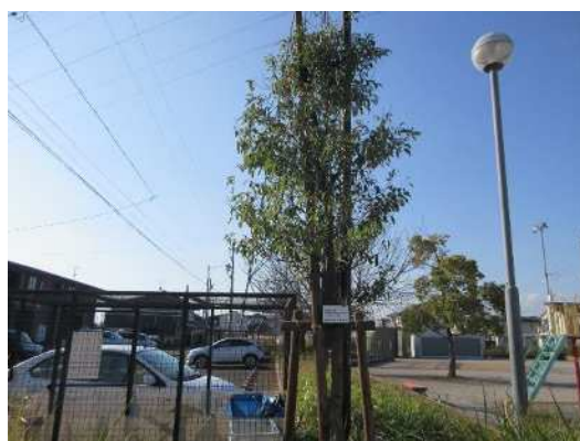
穂南公園（令和2年9月植樹）