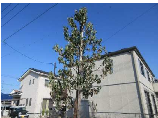
せせらぎ公園（令和2年9月植樹）