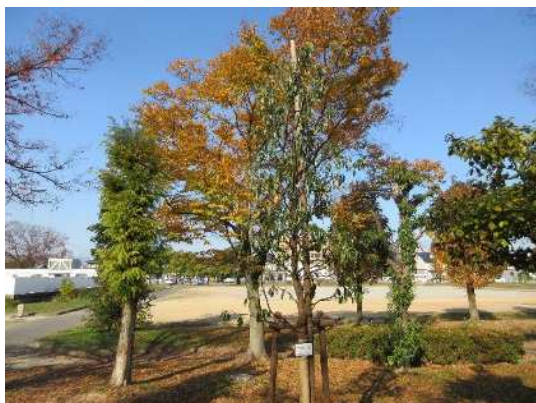
馬場公園（令和2年9月植樹）

瑞穂市では、岐阜県緑化推進委員会から募金額の一部を事業費としていただき、緑化推進事業として馬場公園、南流公園、せせらぎ公園、穂南公園へクスノキを植樹しました。