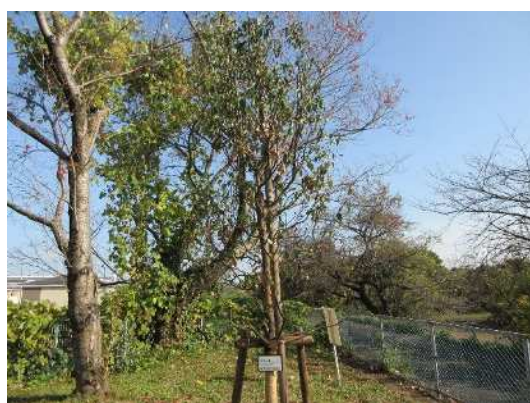
南流公園（令和2年9月植樹）